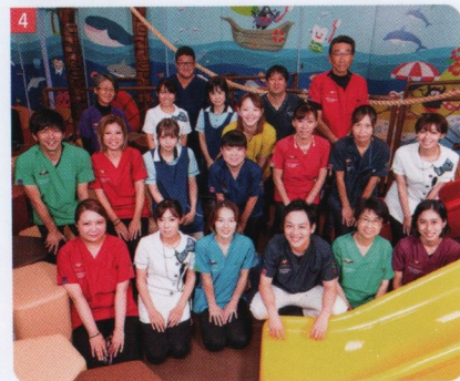
4 スタッフが一丸となって患者を温かく迎える