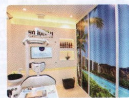
個室の診療室は内装に工夫を凝らし、患者を楽しませている

心地良いハワイアン音楽が流れ、大きな水槽には熱帯魚が泳ぐ。エンターテインメント性があふれる院内には、誰もがわくわくする仕掛けが盛りだくさん。2階の小児歯科フロアには、遊園地の美術スタッフが手がけた大型キッズスペース「マハロキッズランド」を設置。保育士が常駐して子どもたちを見守るので安心だ。4階の成人メンテナンス専用ルームは、ダイヤモンドヘッドの景観写真が広がる部屋やワイキキのヨットクラブ風の部屋などそれぞれ趣が違い、3ヵ月に1度の頻度で定期検診に来ると、1年半で6室すべてを回ることができるそう。大人も楽しめる工夫で、定期検診のモチベーションアップにつなげている。