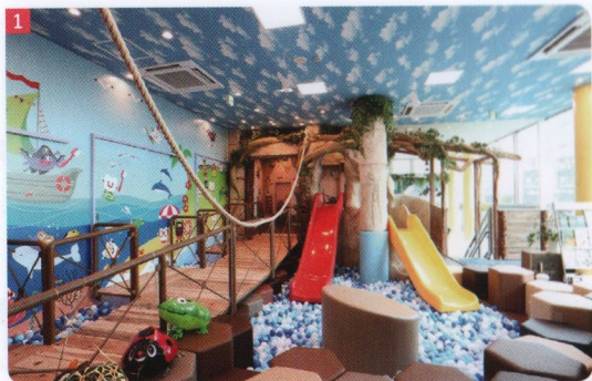
1 大型キッズスペース。保育士が常駐し、安心して過ごせる 2 明るく開放感のある院内。24時間換気システムが稼働している 3 天気の良い日はガーデンテラスで診療を持つことが可能だ