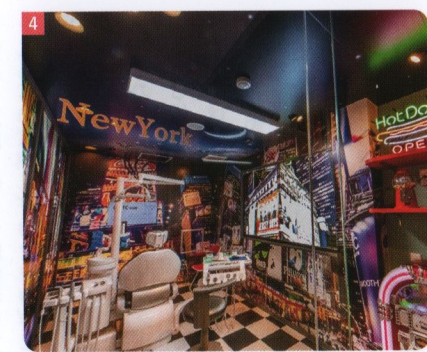
4 こだわりのインテリアが施された、予防歯科専用ルーム

ぷを提供することで、QOLの向上に役立てばうれしいです」さらに、同院が最も注力しているのが、虫歯や歯周病などの重症化を防ぎ、歯を守るための予防歯科の分野だ。歯のメンテナンスに通う患者のモチベーションアッ