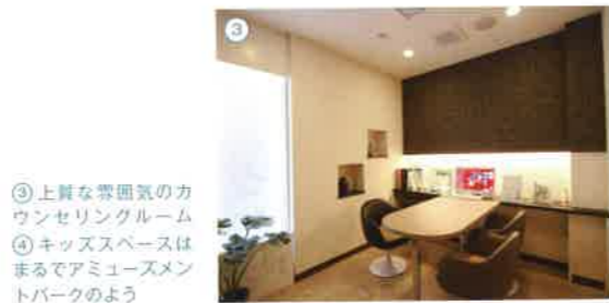
③ 上質な雰囲気のカウンセリングルーム ④ キッズスペースはまるでアミューズメントパークのよう