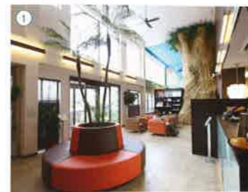
① 患者へのおもてなしがたくさん施されている待合スペース。② 4部屋ある個室ユニットは、それぞれコンセプトが異なる

る。また、口臭やドライマウスにも対応している。特に力を入れているのが予防歯科。同院の患者は歯の健康に対する意識が高く、半数の人がメンテナンスを受けに来ている。院内にはメンテナンス専用の部屋を4つ設け、それぞれに「ハワイ」「パリ」「イタリア」「日本」とテーマがある。日本の部屋では桜の景色、イタリアでは高級車のエンブレムが眺められるなど各国の特徴が反映されている。3カ月ごとに検診を行うと、1年ですべての部屋を回れるため、患者のモチベーション維持に一役買っている。